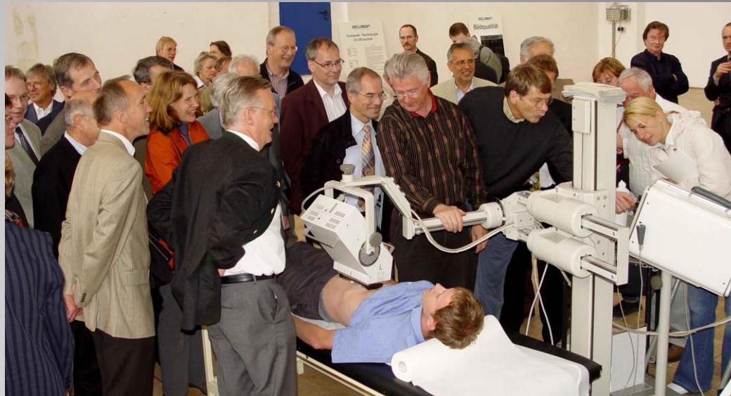
Gern gesehene Gäste in Lennep/Dahlerau (z.B. die Ultraschall-Kursleiter der Inneren Medizin)