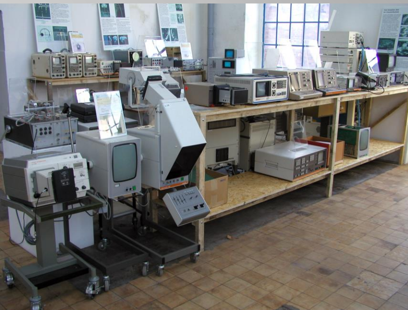
B – mode