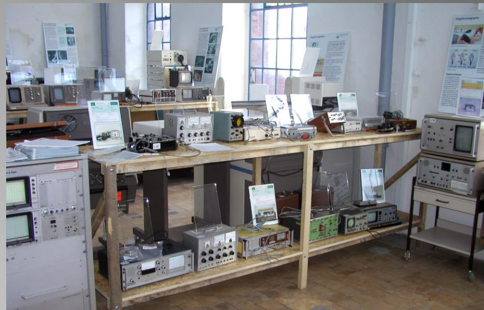
Doppler - devices