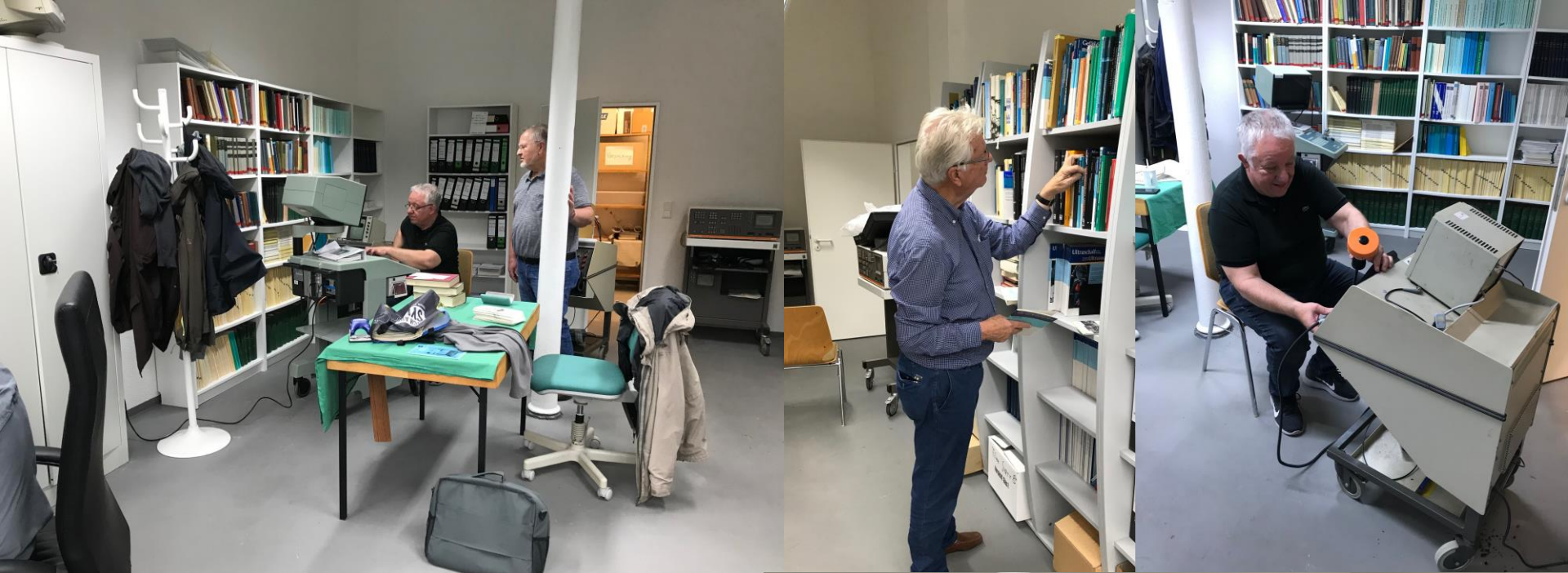
Arbeitstage in Dahlerau mit Gerätewartung und Literaturarbeit