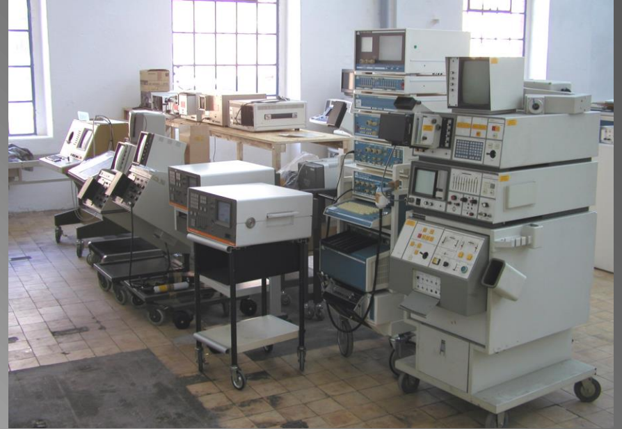
B – mode