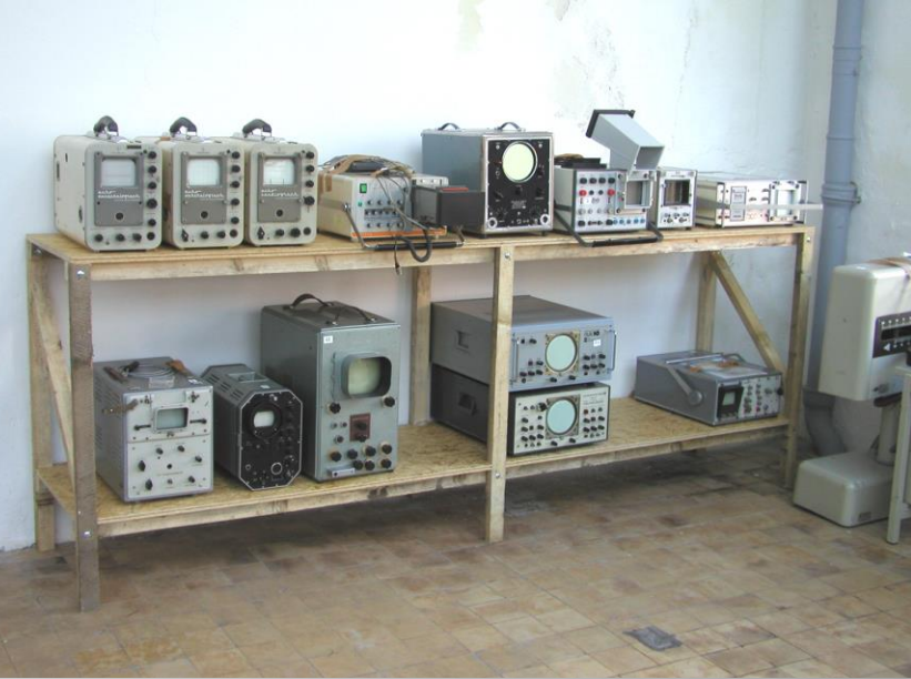
A – scan